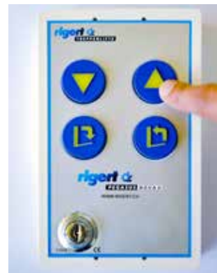
Rufstelle mit einfachster Bedienung