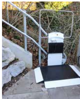
Plattform mit seitlicher Auffahrrampe