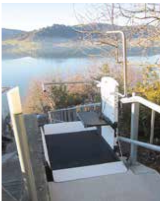
Stufenloser Zugang auf Plattform an Haltestelle