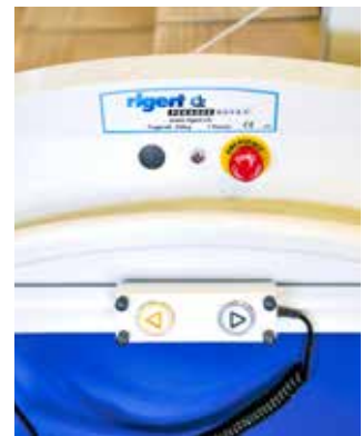
Steuergerät schiebbar; Handlauf durchgehend