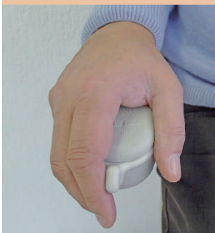
Commande aisée dans chaque accoudoir