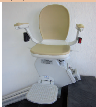
Arrêt du haut - siège droit