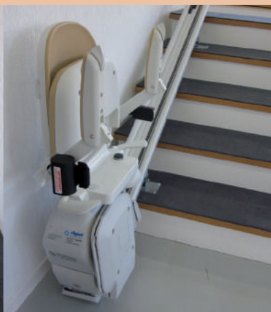
Arrêt du bas - siège replié - l'escalier est libre