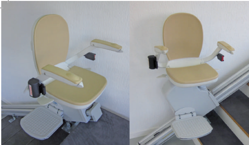
Arrêt du haut - siège tourné à 90° vers le palier pour assurer un transfert sûr