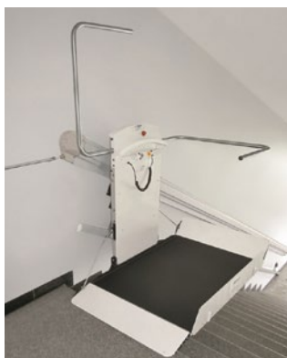
Arrêt du haut; plateforme ouverte