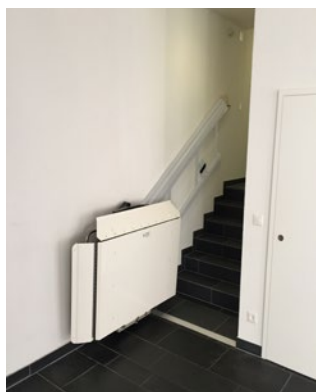
Arrêt du bas; plateforme fermée