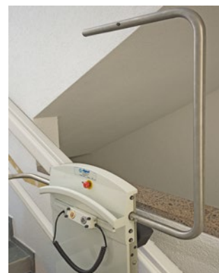
Commande sur le véhicule; main courante continue