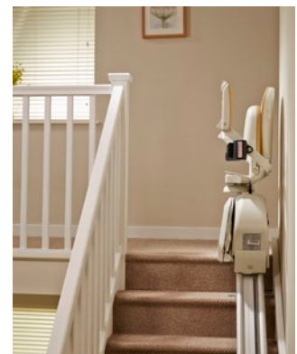
Arrêt du haut - siège plié - l'escalier est libre