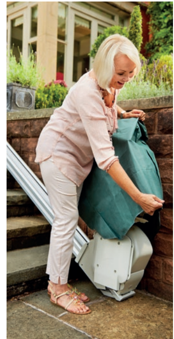
Monte-escalier avec protection