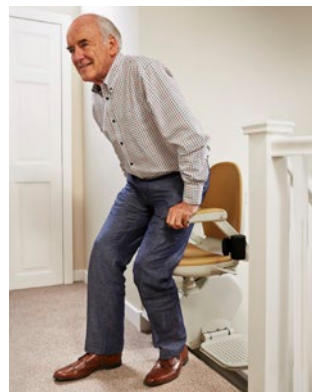
Arrêt du haut – siège tourné vers le palier pour assurer un transfert sûr