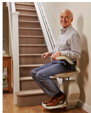
Arrêt du bas