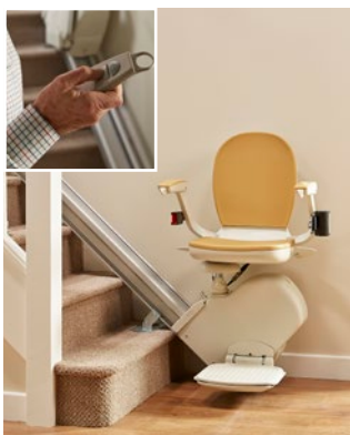
Arrêt du bas