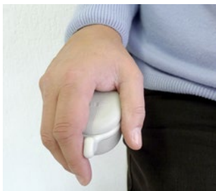
Commande aisée dans chaque accoudoir