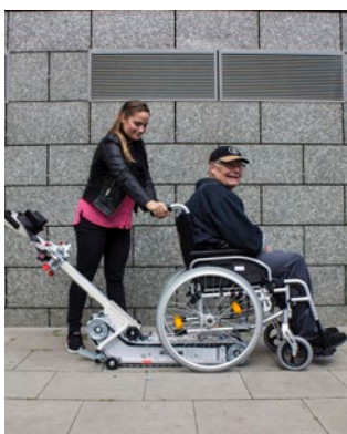
Rollstuhl über die Treppenraupe ziehen