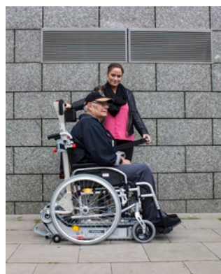
Person im Rollstuhl anurten