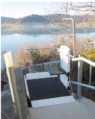
Stufenloser Zugang auf Plattform an Haltestelle