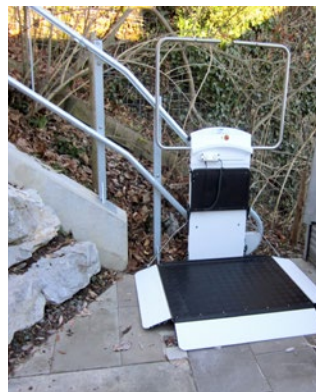
Plattform mit seitlicher Auffahrrampe