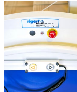
Steuergerät schiebbar; Handlauf durchgehend