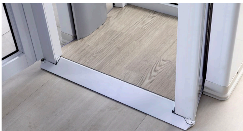
Abgeschrägte Schwelle und rutschfester Bodenbelag