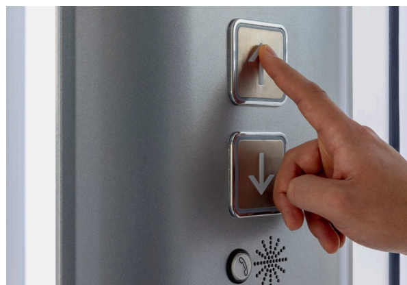
Intuitive Bedienung mit LCD-Statusanzeige in der Kabine