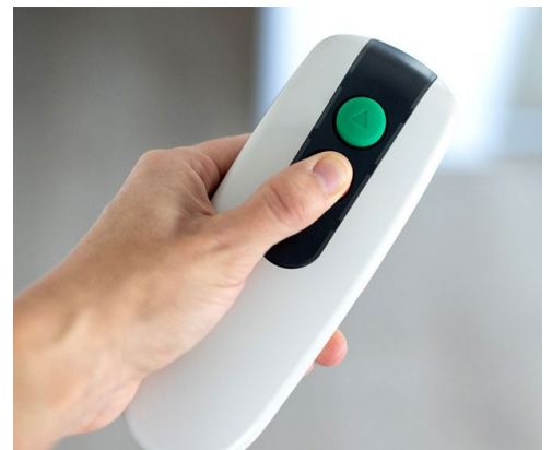
Fernbedienung zum Rufen des Lifts